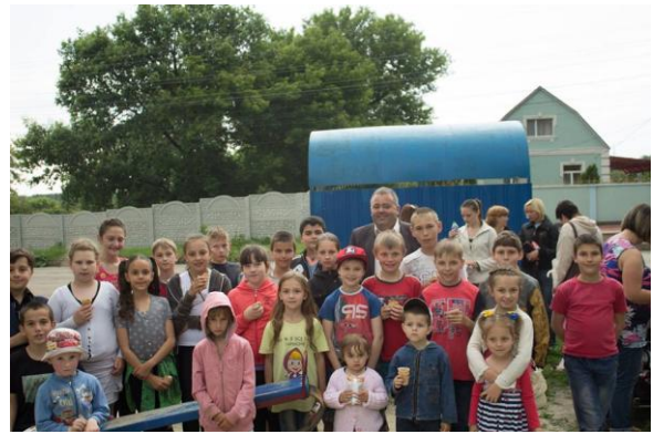
Свято до дня захисту дітей що проходили на спортивно-дитячих майданчиках мікрорайонів «Арнаутово», «Никанорівка», «Масляниківка».