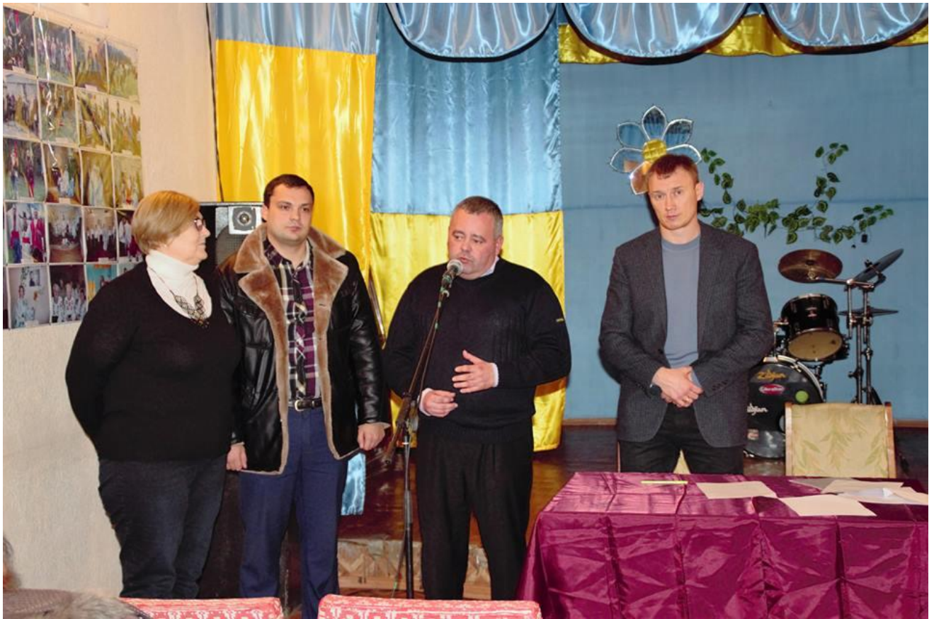
Проведення звіту про роботу депутата.