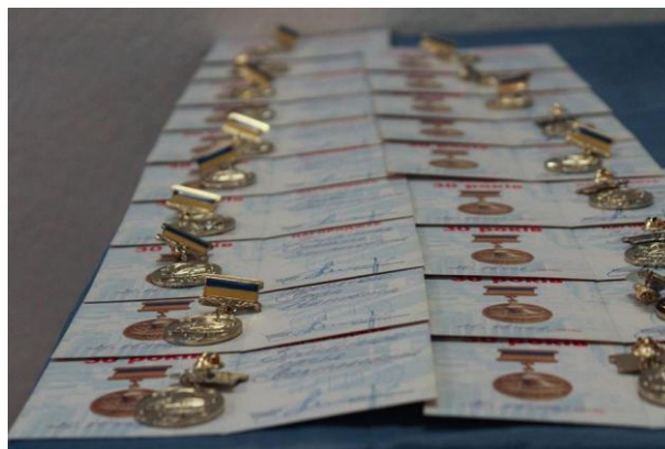
Нагородження ліквідаторів аварії у День пам'яті Чорнобильської трагедії.

Багато було виконано та ще більше роботи попереду, не можна зупинятися на досягнутому. До кінця 2016 року планується виконати ремонт залізного мосту в мікрорайоні Арнаутово, та освітлення вул. Очаківської. Наступного року у планах відремонтувати тротуари та дороги на вулицях Микитенка, Шкільній, Прирічній, Квітковій, провулку Маріупольському та інших, розчистити недіючі кладовища, відновити освітлення низки вулиць, завершити ліквідацію стихійного сміттєзвалища біля діючого кладовища, облаштувати автобусні зупинки та багато іншого.