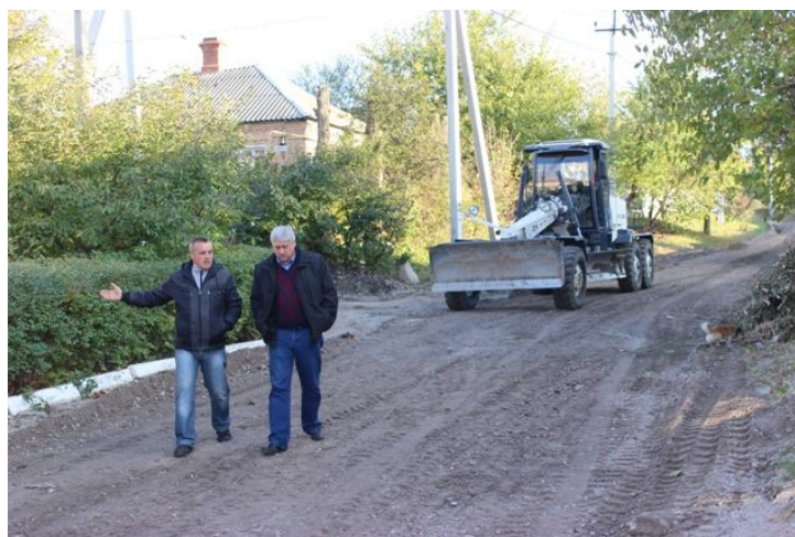
Прогрейдеровано 15 вулиць округу.