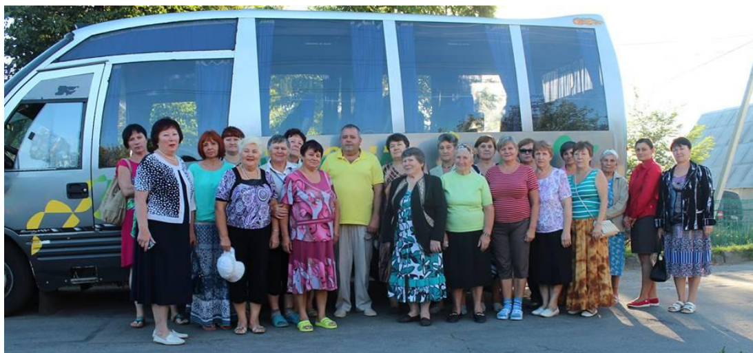
Подорож до жіночого храму у місті Лебедин.