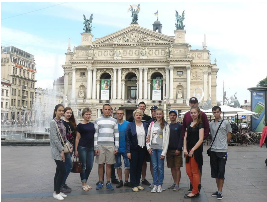
Подорож у Львів для випускників 2016 ЗОШ №33.