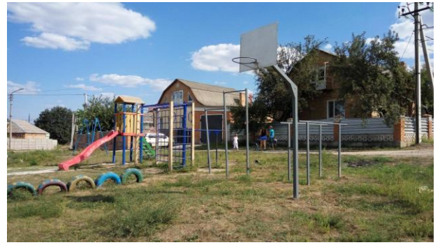
Дитячі майданчики за адресам: вул. Микитенка № 5 та Панфьорова № 47.