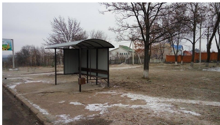
Зупинка громадського транспорту на розі вулиць Бобринецький шлях та Ярошенка.