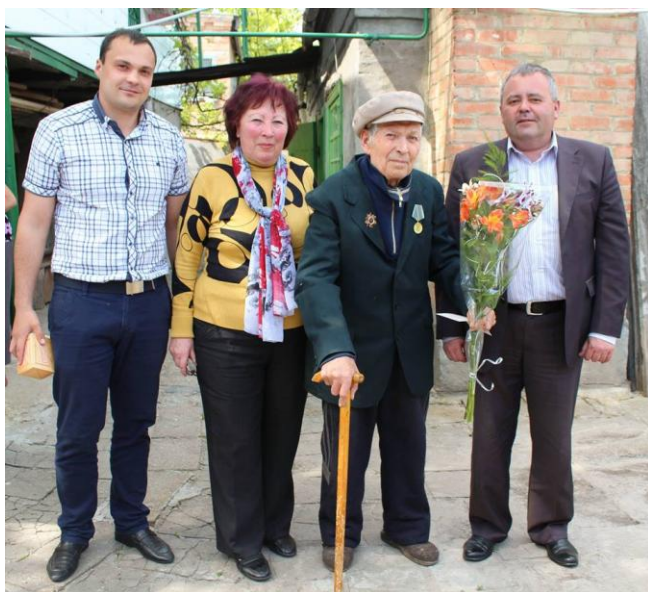
Привітання ветеранів з днем Перемоги