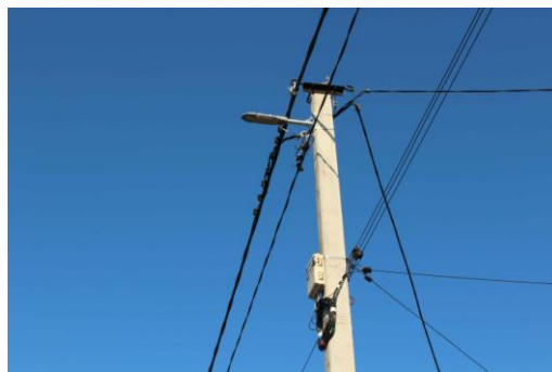
Вулиці В. Домонтовича (Буденного) та Панфьорова.