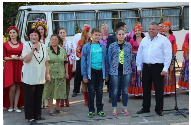
Свято Дня Міста.