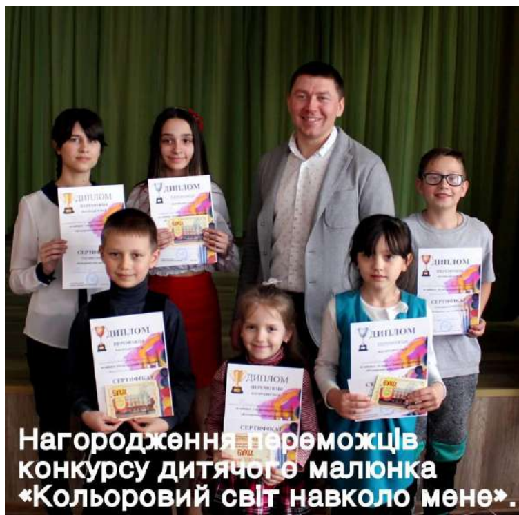
Нагородження переможців конкурсу дитячого малюнка «Кольоровий світ навколо мене».