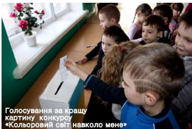
Голосування за кращу картину конкурсу «Кольоровий світ навколо мене»

В школі було проведено різноманітні заходи, щодо розвитку дитини, такі як: конкурсу дитячого малюнка «Кольоровий світ навколо мене», Шкільний футбольний турнір пам'яті полеглого воїна АТО Дмитра Придатка та інші.