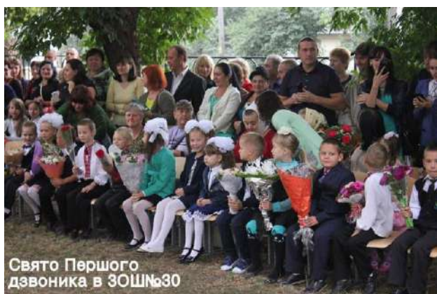
Свято Першого дзвоника в ЗОШ №30