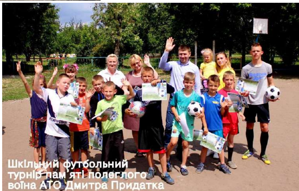
Шкільний футбольний турнір пам'яті полеглого воїна АТО Дмитра Придатка