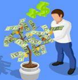
АПК, агроинфраструктура, агротех