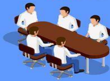
Фармацевтика и медицина