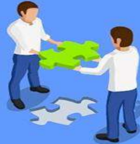
Инфраструктура (её строительство)