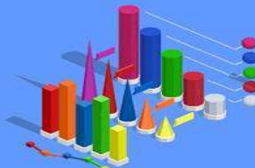
Финсектор и финтех