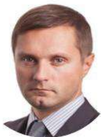
Юрій Терентьєв Голова Антимонопольного комітету України