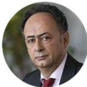
Хюг Мінгареллі Голова Представництва ЄС в Україні