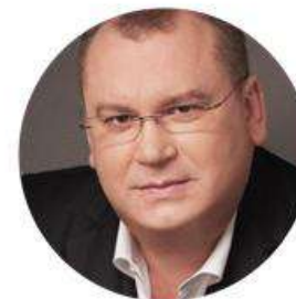
Валентин Резніченко Голова Дніпропетровської обласної державної адміністрації