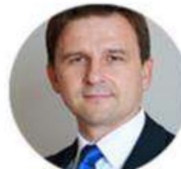
Dmytro Krepak Visa Inc.