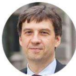
Олег Чурій Заступник голови НБУ