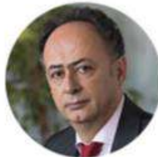
Hugues Mingarelli Delegation of the EU to Ukraine