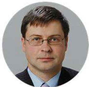
Валдіс Домбровскіс Віце-президент Європейської Комісії