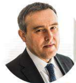
Люк Якобс Надзвичайний та Повноважний Посол Бельгії в Україні