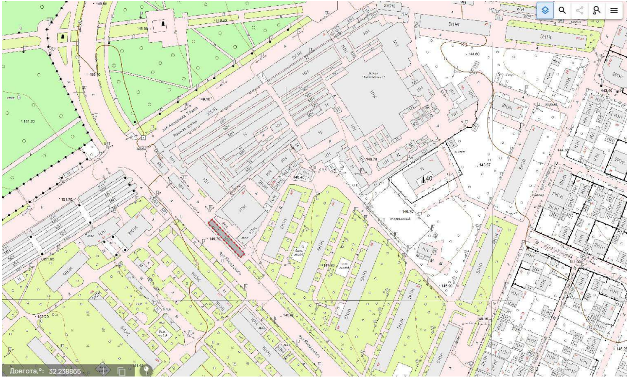
Схема земельної ділянки